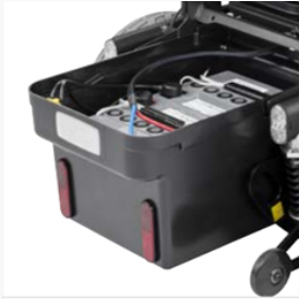
Servicefreundlichkeit: Einfache Batteriewartung durch ausziehbaren Batteriekasten