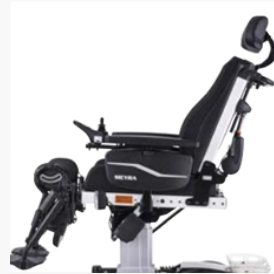
300 mm Sitzhub