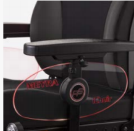
Seitenteilbeleuchtung mit individueller Gravur