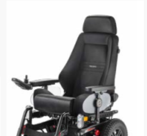
Recaro-Sitz in schwarzem Kunstleder