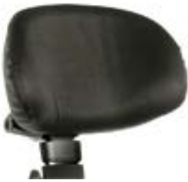
// QPL030430 & QPL030431