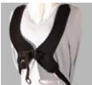
// JAY090040 - JAY090042