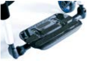
// XES050132 Fußbrett, durchgehend, leichtgewicht, Carbon