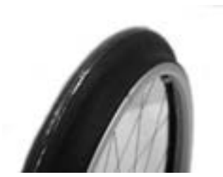
// XES070208 Greifreifen Maxgrepp®