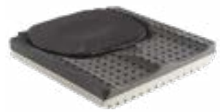
// JAY020004 JAY Lite Kissen (Bild zeigt Kissen ohne Bezug)