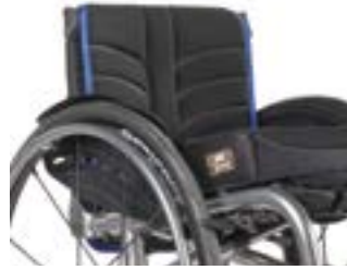
// XES 030317 EXO PRO Rücken- bespannung (Exo Evo Version)