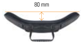
// Mittlere Kontur (MC)