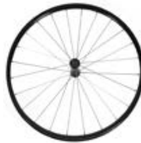
// XES070003 Antriebsrad, Leichtgewicht