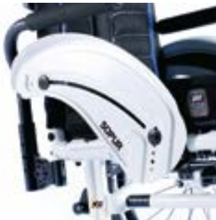
// XES040103 Aluminium, Kleiderschutz, Kälteschutz