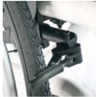
// XES060003 Kompaktbremse