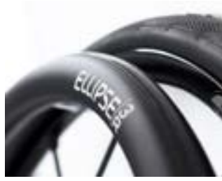
// XES070212 Greifreifen Ellipse 3R