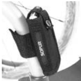
// XES090026 Handytasche