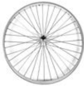
// XES070002 Antriebsrad, Design