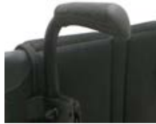
// XES 030204 Schiebegriffe höhenverstellbar