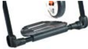
// XES050059 Fußbrett, durchgehend, leichtgewicht, Performance