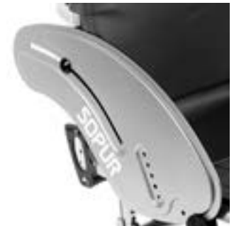
// XES040102 Aluminium, Kälteschutz