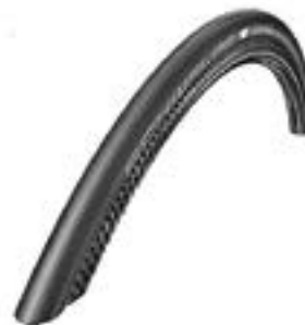
// XES070107 Schwalbe One