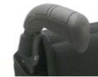
// XES 030201 Schiebegriff, lang