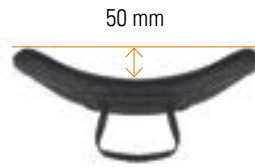
// Flache Kontur (SC)