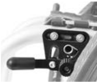
// XES060001 Standardbremse