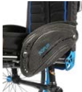
// XES040104 Carbon, Kleiderschutz, Kälteschutz