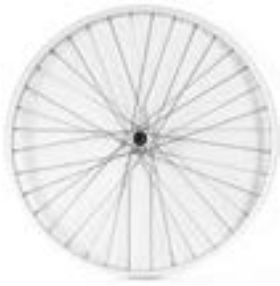
// XES070001 Antriebsrad, Universal