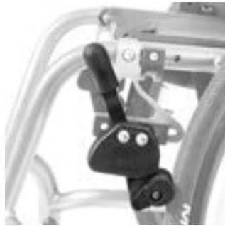
// XES060002 Kniehebelbremse