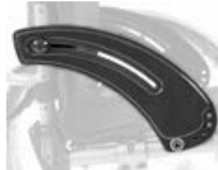
// XES040101 Carbon, Kälteschutz, schmal