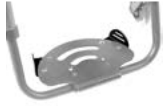
// XES050127 Seitenschutz, einstellbar, zur seitl. Abgrenzung des Fußbretts