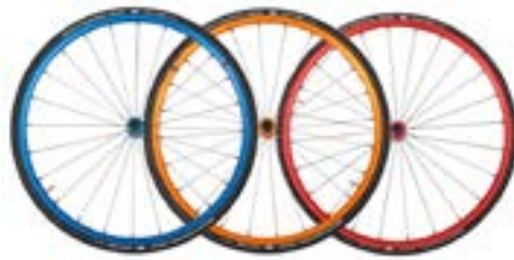
// XES100336-100338 Antriebsrad, Leichtgewicht 24" mit Felge und Nabe farbig eloxiert und schwarzen Speichen