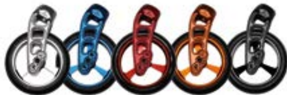
// Farben für Lenkradgabel und Lenkrollen (Abbildung: Lenkradgabel Carbotecture 111 mm mit Lenkrad, Vollgummi (weich), Felge: Aluminium 4")