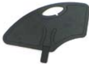
// XES040107 Kunststoff, abnehmbar