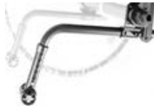
// XES090050 Sicherheitsrad, aufsteckbar