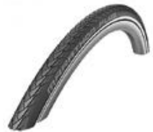
// XES070104 Schwalbe Marathon Plus Evolution