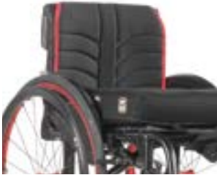
// XES 030316 EXO Rücken- bespannung (Exo Evo Version)