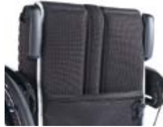
// XES 030203 Schiebegriffe abklappbar