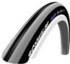
// XES070101 Schwalbe Right Run