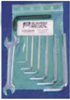
// XES090000 Werkzeugsatz