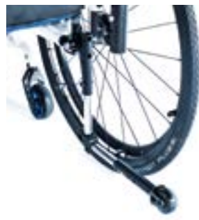
// XES090004 Sicherheitsrad, abschwenkbar