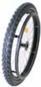
// XES07010 Mountainbike Rad