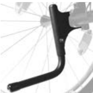
// XES090001 Ankipfbügel