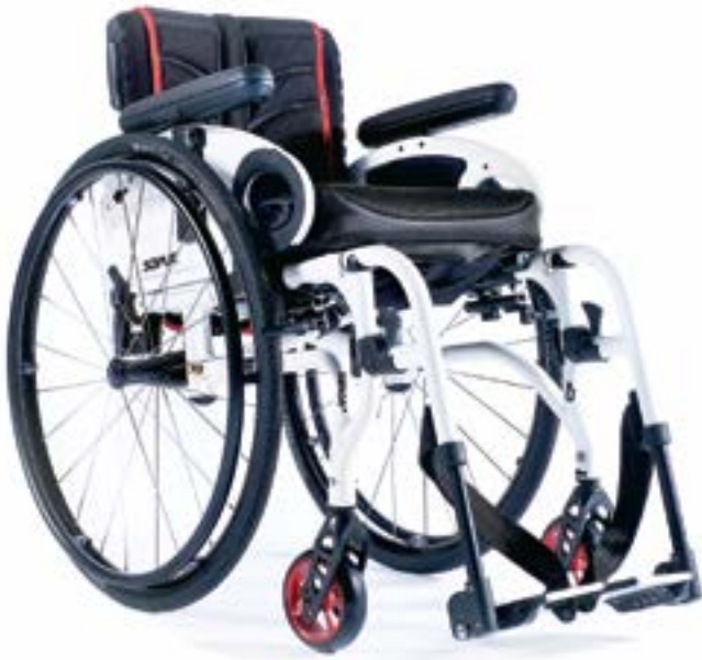
// XES010015 Rahmen SA (wegschwenk-/abnehmbare Fußraste), max. Zuladung 125 kg