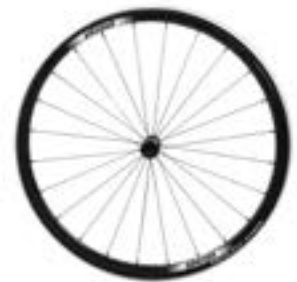
// XES070004 Antriebsrad, Proton