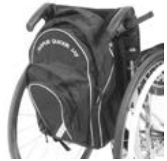
// XES090030 Rucksack