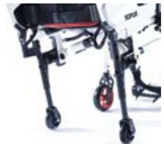
// XES090010 Transittrollen