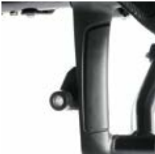
// NSW070701 Adapter, Leichtgewicht