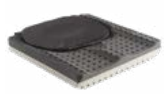
// JAY020004 JAY Lite Kissen (Bild zeigt Kissen ohne Bezug)