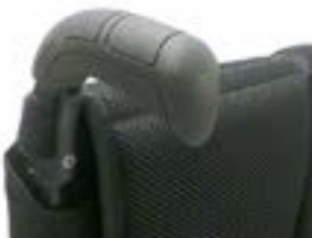
// NSW030201 Schiebegriff, lang