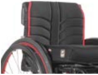
// NSW030316 EXO Rückenbespannung (Exo Evo Version)