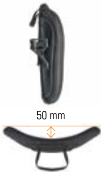
// Flache Kontur (SC)