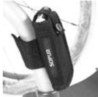
// NSW090026 Handytasche