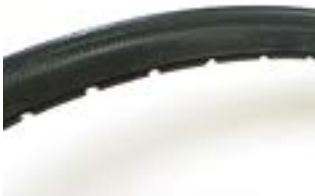
// NSW070102 Bereifung, pannen-sicher