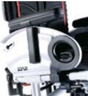
// NSW04000x Deskseitenteil, Arm- polster, hochschwenk- und abnehm- bar