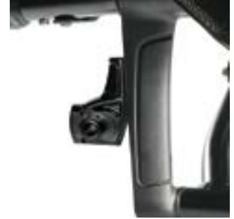
// NSW070703 Adapter, Standard