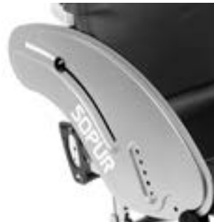
// NSW040102 Aluminium, Kälte- schutz