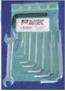
// NSW090000 Werkzeugsatz