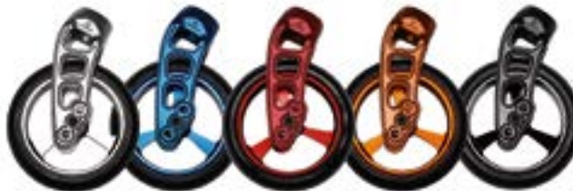
// Farben für Lenkradgabel und Lenkrollen (Abbildung: Lenkradgabel Carbo-structure 111 mm mit Lenkrad, Vollgummi (weich), Felge: Aluminium in 4"