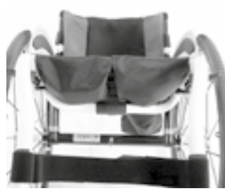
// NSW020003 Sitzbespannung mit zwei Utensilientaschen