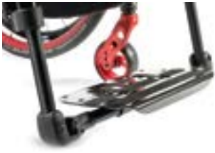
// NSW050025 Fußbrett, durchgehend, leichtgewicht, Carbon