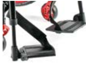
// NSW050022 Fußbrett, geteilt, Aluminium, winkeleinstellbar, hochklappbar (seitlich)