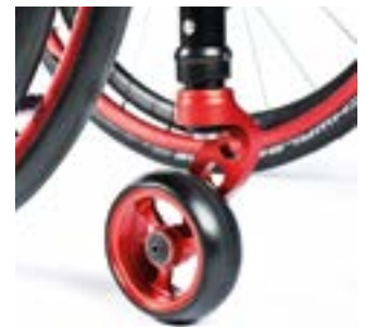
// NSW080008 Lenkradgabel, Ein-arm in Farbe rot, hier abgebildet mit Lenkrad, Vollgummi (weich), Felge: Aluminium 4", rot