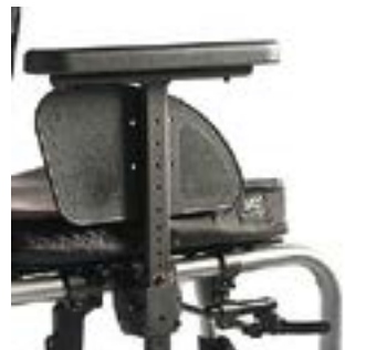
// NSW040052 Seitenteil Zentral- stütze, Armpolster, tiefen- und hö- henverstellbar