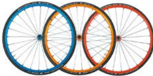
// NSW100336 - 100338 Antriebsrad, Leichtgewicht 24" mit Felge und Nabe farbig eloxiert und schwarzen Speichen