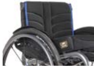
// NSW030317 EXO PRO Rückenbespannung (Exo Evo Version)