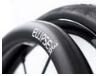
// NSW070208 Greifreifen Maxgrepp® // NSW070212 Greifreifen Ellipse 3R