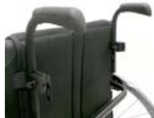
// NSW030204 Schiebegriffe höhenverstellbar