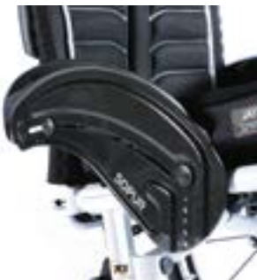
// NSW040104 Carbon, Kleider- schutz, Kälteschutz