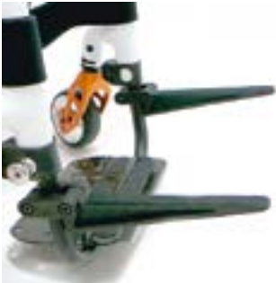
// NSW090019 Caddy, hochklappbarer Träger für Taschen