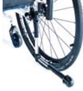
// NSW090004 Sicherheitsrad, abschwenkbar