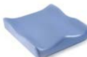
// JAY020003 JAY Soft Combi P Kissen (Bild zeigt Kissen ohne Bezug)