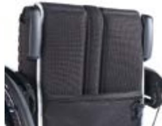
// NSW030203 Schiebegriffe abklappbar