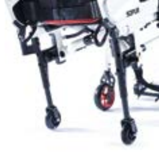
// NSW090010 Transitrollen