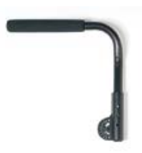
// NSW040117 Seitenteil Armleh- nenrohr