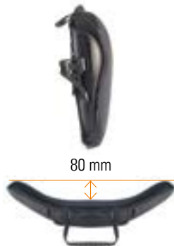
// Mittlere Kontur (MC)