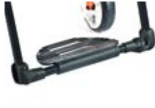
// NSW050125 Fußbrett, durchgehend, leichtgewicht, Performance