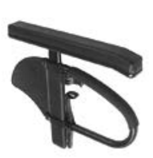
// NSW040050 Seitenteil Zentral- stütze, Armpolster