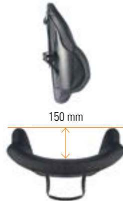
// Tiefe Kontur (MDC)