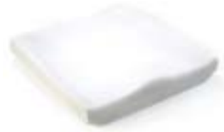
// JAY020002 JAY Basic Kissen (Bild zeigt Kissen ohne Bezug)