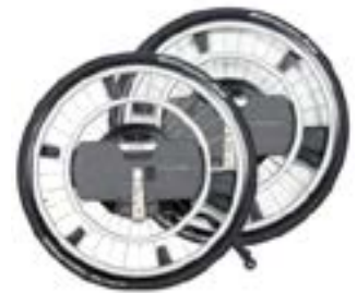
// WDO070201 WheelDrive