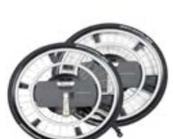
// WDO000201 WheelDrive Plus