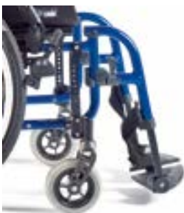
// LI1010017 Neuro Rahmen