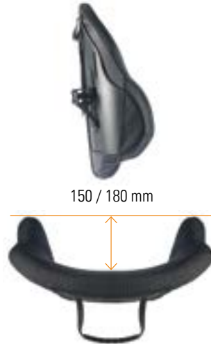
// Mittlere Tiefe Kontur (MDC /XMDC)