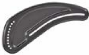
// LI1040102 Aluminium, Kälteschutz