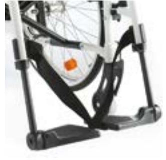
// LI1050020 Fußbrett geteilt Kunststoff, winkelverstellbar