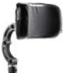
// LII030410 Kopfstütze, groß, höhen- / tiefen- / winkelverstellbar, 23 x 11 cm