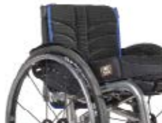
// LII030317 EXO PRO Rückenbespannung (Exo Evo Version)