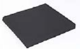
// Sitzkissen, Bezug mit Reißverschluss, schwarz