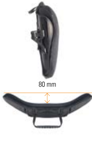
// Mittlere Kontur (MC)