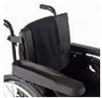
// LI1040110 Hemi-Armauflage XL (tiefen- und winkelverstellbar)