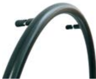
// LI1070207 Supergrip®