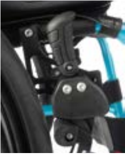
// LI1060002 Kniehebelbremse