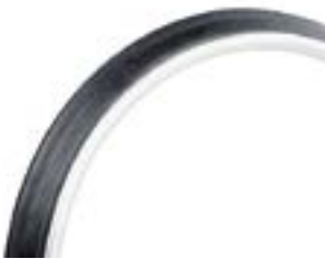
// LI1070208 Max Grepp®