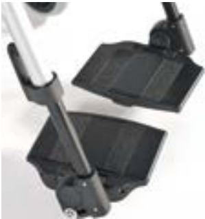
// LI1050022 Fußbrett geteilt Aluminium