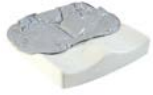
// JAY020007 JAY Easy Fluid Kissen (Bild zeigt Kissen ohne Bezug)