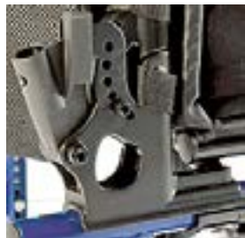
// LII030023 und LII030025 Rückenwinkeleinstellbar (-5° bis 25°)