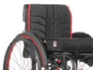
// LII030316 EXO Rückenbespannung (Exo Evo Version)