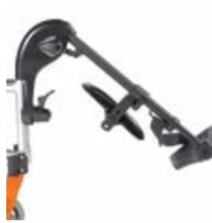
// LI1050009, LI1050010, LI1050011 Fußbretthalter hochschwenkbar (ELR)