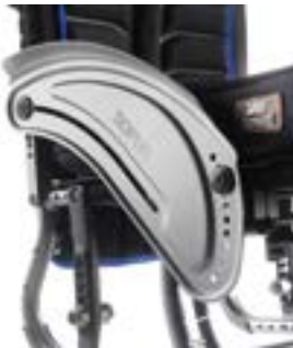
// LI1040103 Aluminium, Kleiderschutz, Kälteschutz