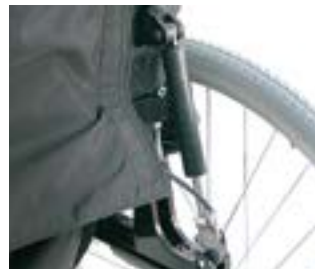
// LII030014 Gasdruckfeder, Schiebegriffe lang (0° - 30°)