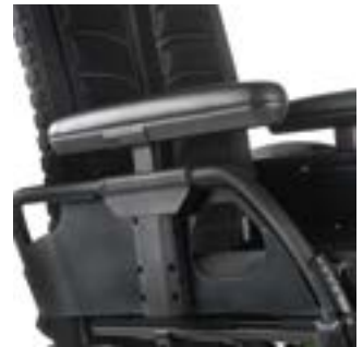
// LI1040058 Seitenteil höhenverstellbar, Einhandbedienung, Armpolster kurz