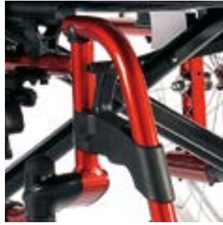
// LI1050003, LI1050004, LI1050005 Fußbretthalter Kunststoff 100°