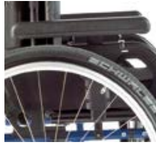
// LI1040054 Seitenteil mit Armpolster (300 mm), höhen- und tiefenverstellbar