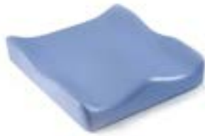
// JAY020003 JAY Soft Combi P Kissen (Bild zeigt Kissen ohne Bezug)