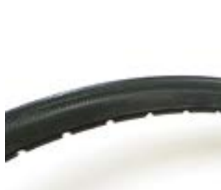
// LI1070102 Bereifung, pannen-sicher