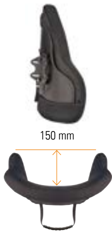
// Becken Tiefe Kontur (PDC)