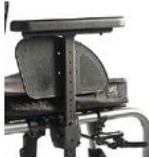
// LI1040052 Seitenteil Zentralstütze, Armpolster, tiefen- und höhenverstellbar