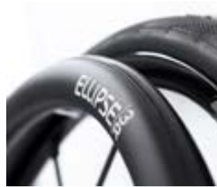
// LI1070212 Ellipse 3R