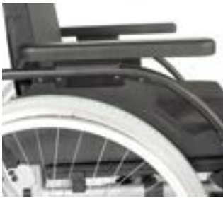
// LI1040053 Seitenteil mit Armpolster