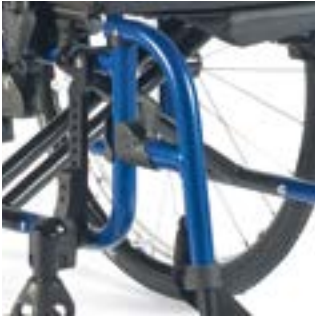
// LI1050006, LI1050007, LI1050008 Fußbretthalter Aluminium 100°