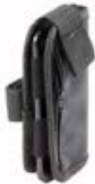
// LI1090026 Handytasche