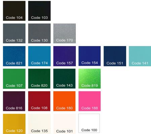
XN 010, Rahmenfarben