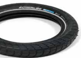
Schwalbe Big Apple Reifen m. Pannenschutz

12 x 2.00" (310 x 50 mm) 14 x 2.00" (360 x 50 mm)