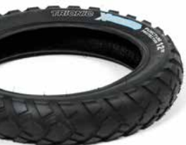
Trionic X-Country Reifen m. Pannenschutz