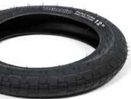
Trionic Primera Reifen m. Pannenschutz

12 x 2.2" (310 x 57 mm) 14 x 2.2" (360 x 57 mm)