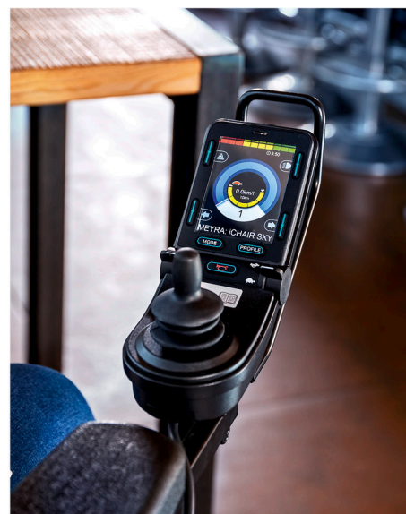
Multifunktionsmodul mit Memory-Funktion Neben der Stehfunktion und dem Sitzlift bietet der iCHAIR SKY noch weitere Positionen. Mehr dazu auf der nächsten Seite!