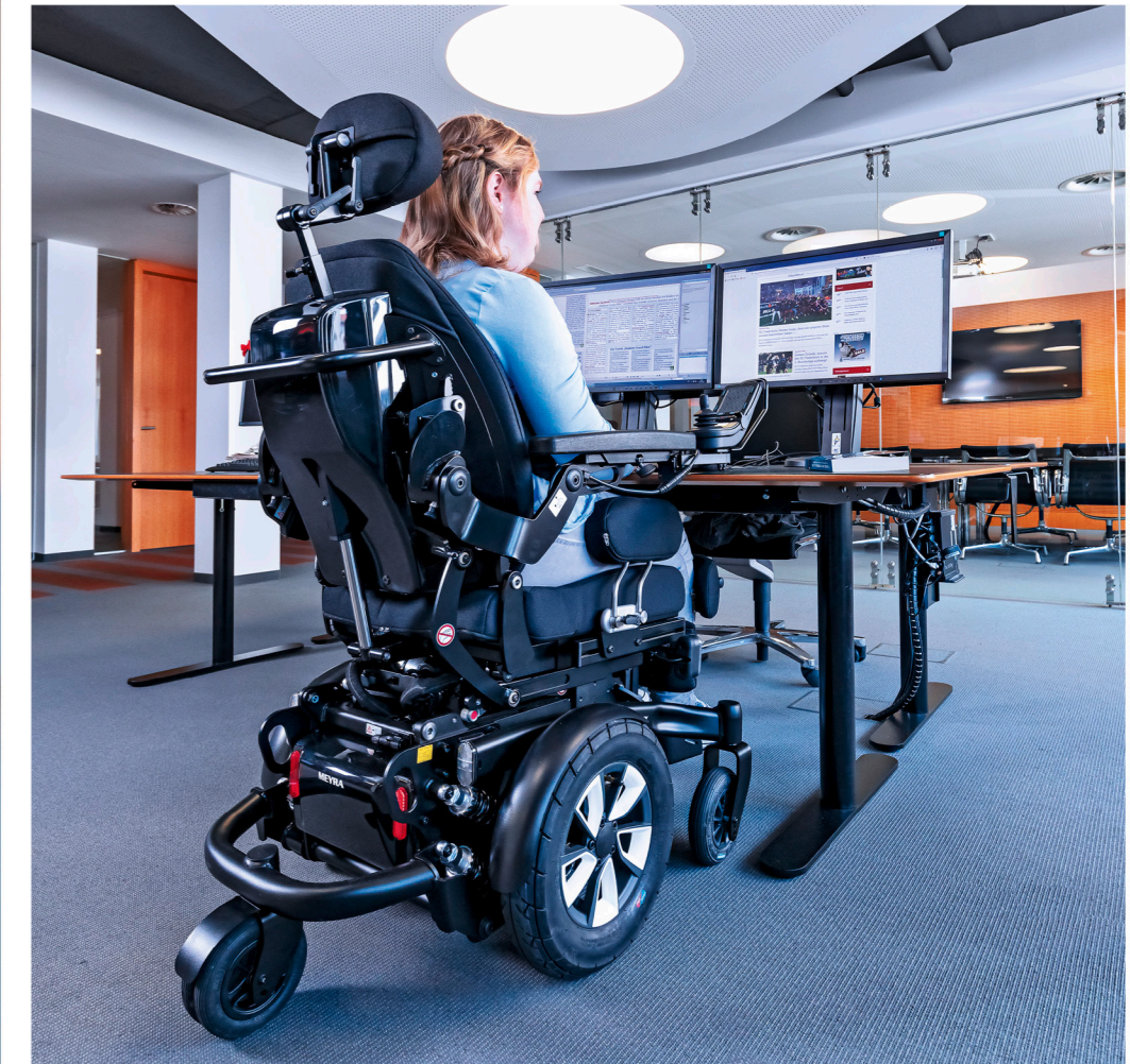
Mittelradantrieb mit ideal platzierten Lenkrädern, geringe Sitzhöhe und Gesamtbreite.