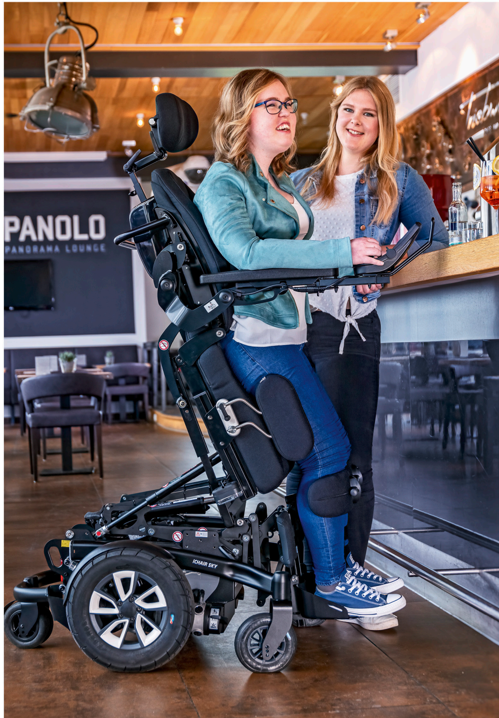
Großer Stehwinkel bis zu 90°, Brustgurt inklusive, Fahren im Stehen (3 km/h), Aufstehen aus jeder Position möglich