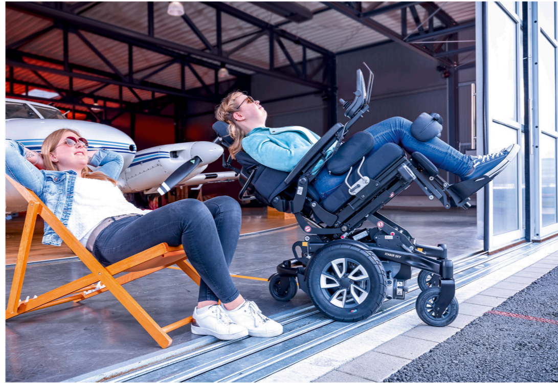
OPTIMALE RELAXPOSITION Mit der Sitzkantelung von 0° bis 40° lässt sich eine optimale Relaxposition zum Druckausgleich bestimmen. Beim Fahren mit Kantelung wird die Geschwindigkeit automatisch angepasst.