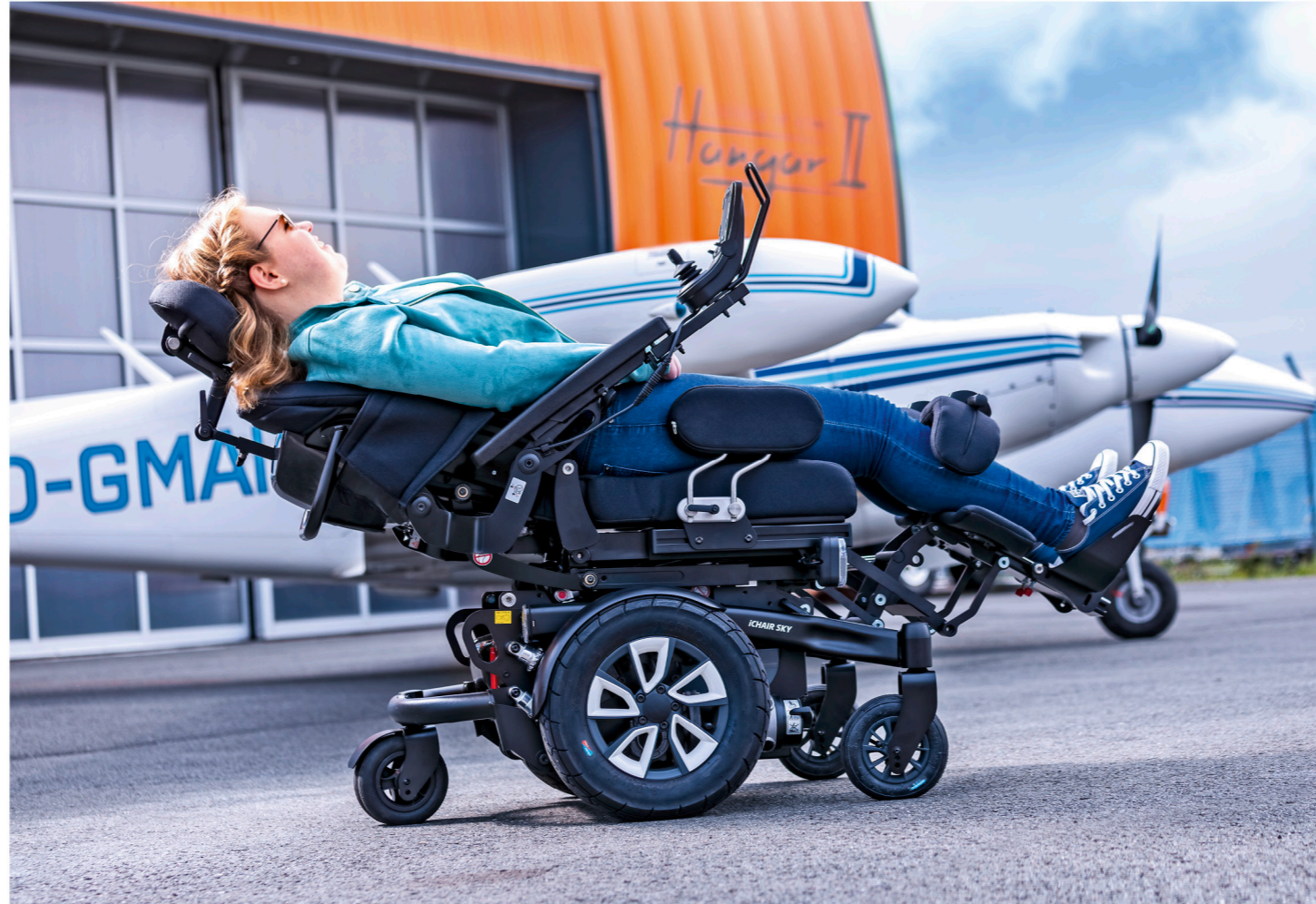
Optional: Die Advanced Liegefunktion mit Biomechanik für Armlehnen und Kopfstütze verbessert die Ergonomie beim Liegen, indem der Kopf gestützt und die Armlehnen auf 45° abgesenkt werden.