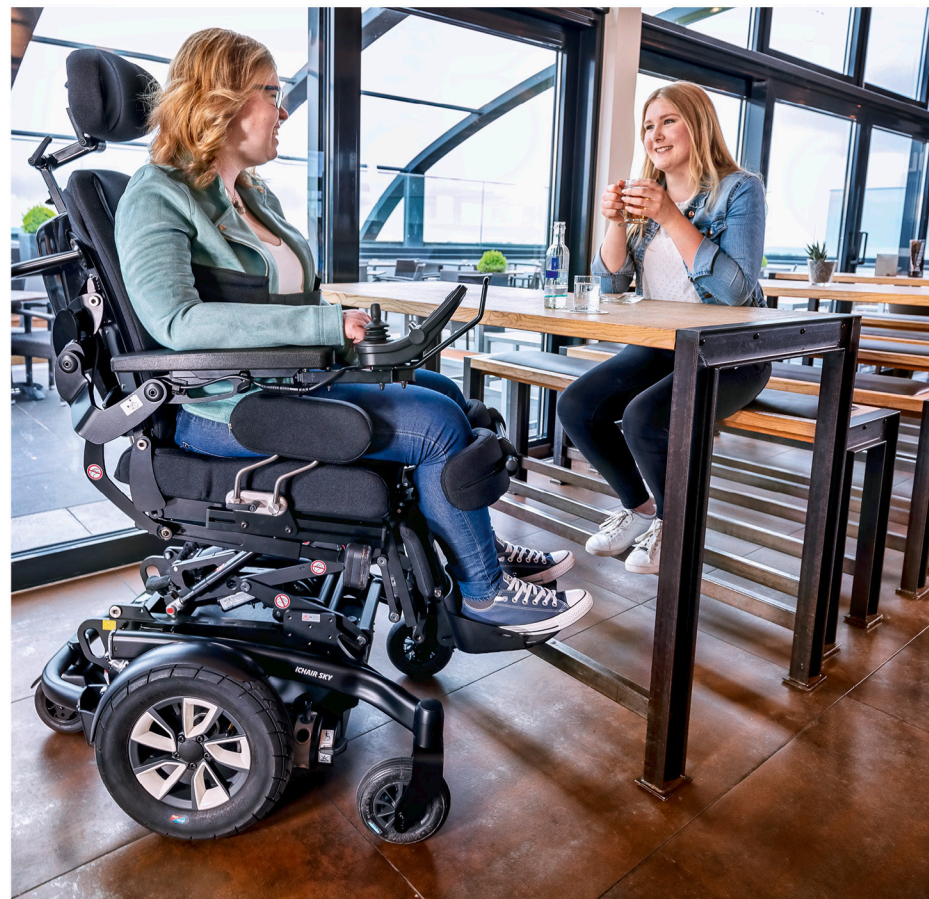
Elektrischer Lift bis zu 200 mm in der Serienausstattung, automatische Geschwindigkeitsanpassung bei der Fahrt