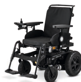
iCHAIR MC BASIC