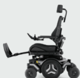
Elektrische und manuelle Beinstütze 90 - 180°