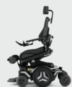
Sitzkantelung (nach vorne) Active Reach* 5 - 20° 20° VS-Beinstützen erforderlich