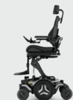
Sitzhöhenverstellung Active Height 0 - 350 mm