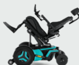
Sitzkantelung 0 - 50°