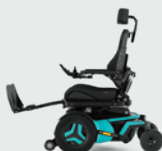
Elektrisch und manuell verstellbare Beinstütze 90 - 180°