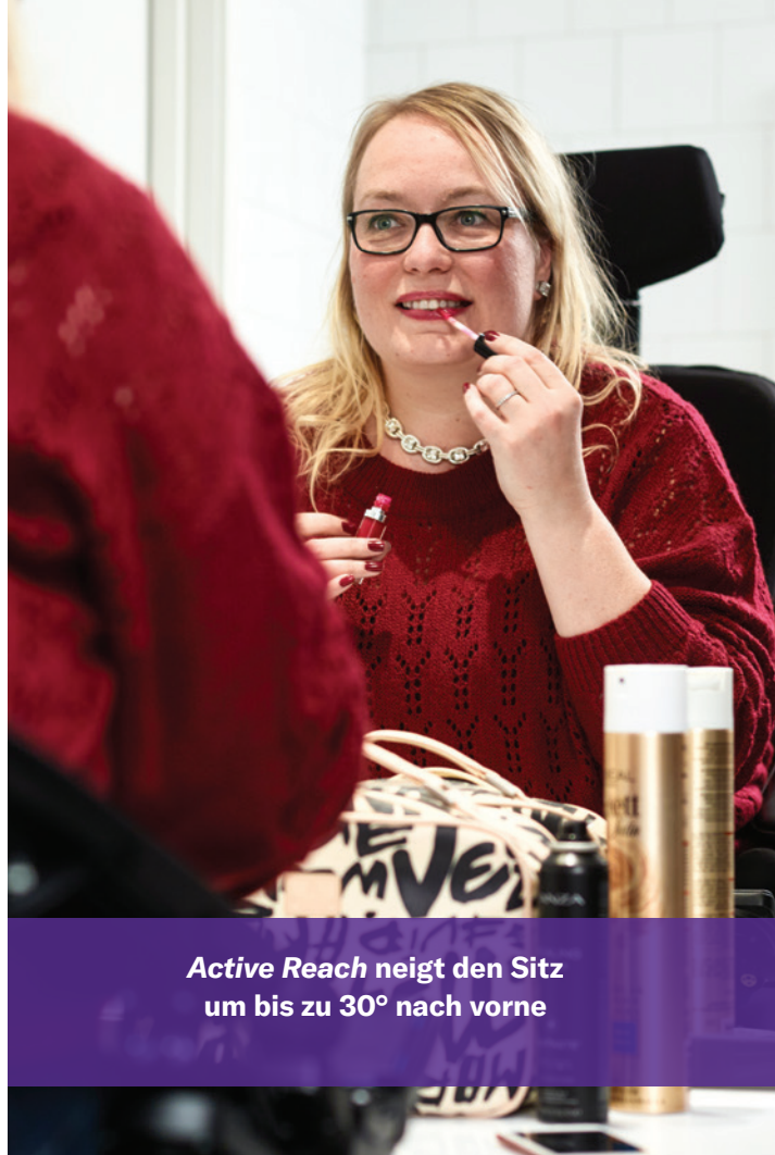
Active Reach neigt den Sitz um bis zu 30° nach vorne

LED-Leuchten sorgen vorne und hinten für mehr Helligkeit und bessere Sicht.