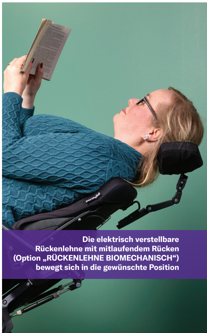
Die elektrisch verstellbare Rückenlehne mit mitlaufendem Rücken (Option „RÜCKENLEHNE BIOMECHANISCH“) bewegt sich in die gewünschte Position