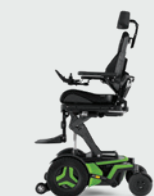
Sitzhöhenverstellung Active Height 0 - 300 mm