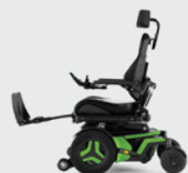
Elektrisch und manuell verstellbare Beinstütze 90 - 180°