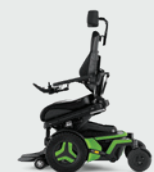
Sitzkantelung (nach vorne) Active Reach 5 - 30° (20°/30° VS-Beinstützen erforderlich)