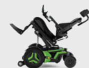
Sitzkantelung 0 - 50°