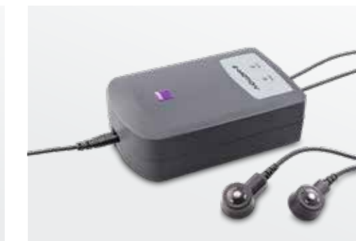
Automatik-Ladegerät: Passt sich automatisch an die Netzspannung an und lädt beide e-motion Akkus in wenigen Stunden (im Lieferumfang enthalten)