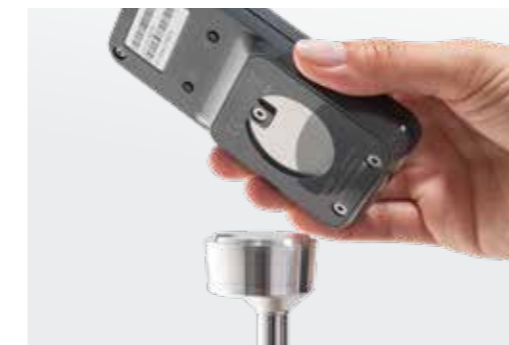
Magnethalterung für ECS-Fernbedienung zur Montage am Rollstuhl (Zubehör)