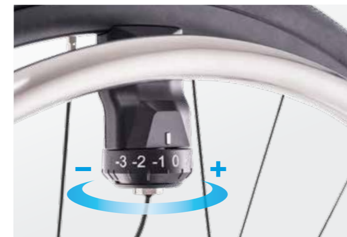
Empfindlichkeit der Fahrsensoren in sieben Stufen einstellbar

Der e-motion ist flexibel: Er ist mit den verschiedensten Rollstuhlmodellen kompatibel und kann an deine individuellen Bedürfnisse angepasst werden. Die Schubkraft-Unterstützung lässt sich an beiden Antriebsrädern unabhängig voneinander einstellen. Mehr oder weniger Kraft in einem Arm ist also kein Problem. Dein Fachhändler oder Therapeut hat zusätzlich die Möglichkeit, weitere Einstellungen an deinem e-motion vorzunehmen, so dass er optimal auf deine Fahrweise abgestimmt ist. Der e-motion ist in drei Radgrößen verfügbar und kann auf Wunsch mit ergonomischen Greifreifen ausgestattet werden. Das sorgt für optimalen Grip in jeder Fahrsituation.