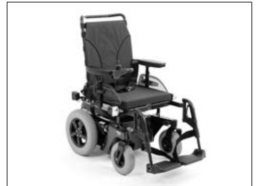
Abbildung zeigt Aufpreispositionen

Artikel-Nr. Heckantrieb: 490E75=1_AC01_C max. Zuladung: 160 kg