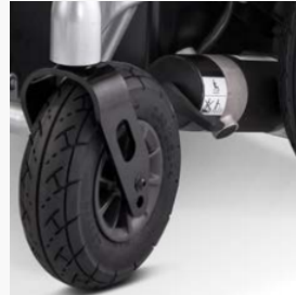
Lenkräder mit Alufelge