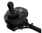
2231 / 2232