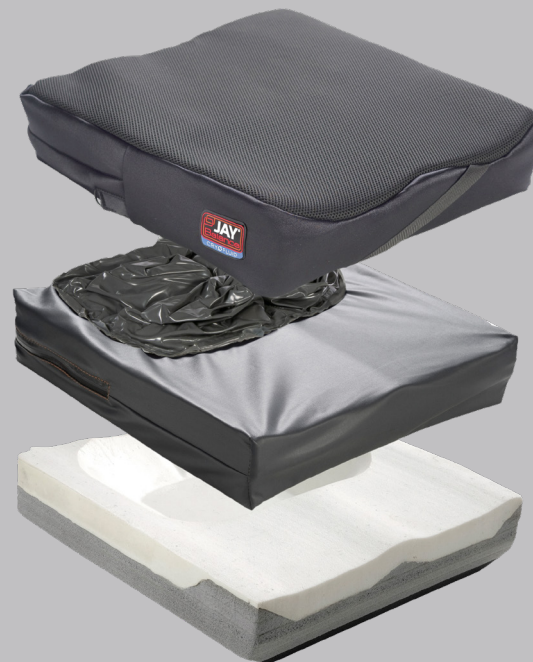
JAY Balance mit Cryo Fluid

Für mehr Schutz und zur Unterstützung eines optimalen Wärme- und Feuchtigkeitstransport besteht das Balance Rollstuhlkissen aus einem inneren, wasserundurchlässigen Bezug sowie aus einem äußeren mikroklimatischen Bezug. Wahlweise kann auch ein Stretch-Bezug (Scherkraftreduzierung) oder ein Inkontinenzbezug bestellt werden.