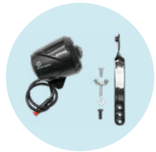
493S164=SK008 LED-Frontlicht, weiß, integriert