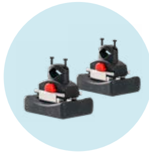
493S164=SK001 2x Traktionsgewichte