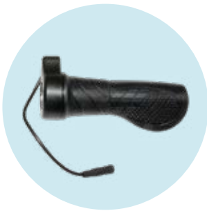
493S164=RK004 Gasdrehgriff, rechts