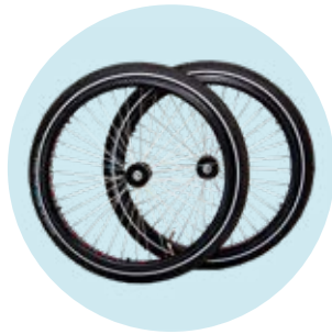
493S164=ST020 24" Fat-Räder (12 mm-Achse)