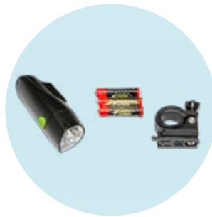
493S164=SK007 LED-Frontlicht, weiß