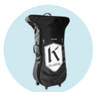
493S164=ST012 Flybag Transporttasche