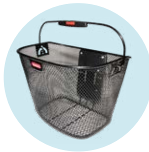
493S164=ST010 Korb 10 l