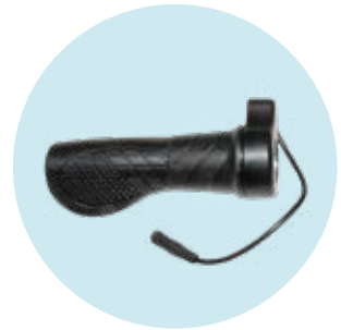
493S164=LK004 Gasdrehgriff, links