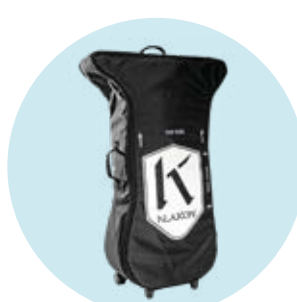
493S164=ST012 Flybag Transporttasche