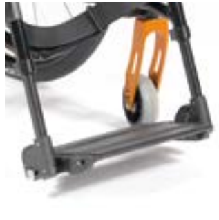
// LI1050023 Fußbrett durchgehend Aluminium