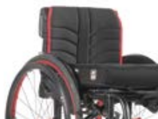
// LII030316 EXO Rückenbespannung (Exo Evo Version)