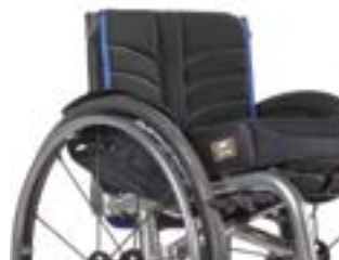
// LII030317 EXO PRO Rückenbespannung (Exo Evo Version)