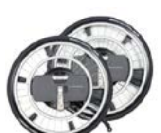
// WDO000201 WheelDrive Plus