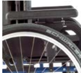
// LI1040054 Seitenteil mit Armpolster (300 mm), höhen- und tiefenverstellbar