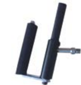
// ATT080027 Tetra Handunterstützung