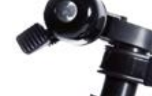
// ATT090085 Klingel