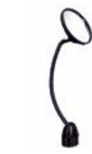
// ATT090067 Rückspiegel