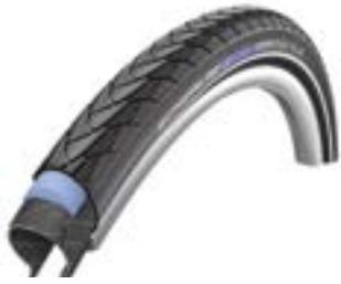
// ATT070104 Schwalbe Marathon Plus Evolution, pannengeschützt