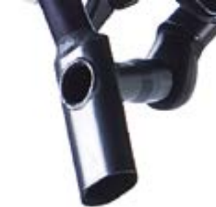
// ATT080025 Griff, vertikal, 25° Winkel, oval, Durchmesser 37 x 21 mm