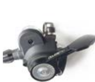
// ATT070044 Universal, 1 Bedienhebel