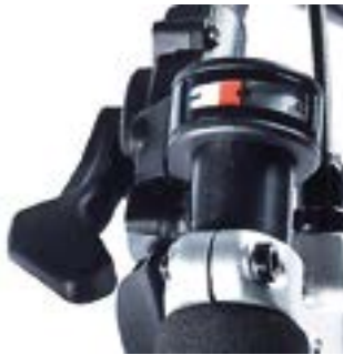
// ATT070045 Daumenschalter