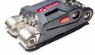
// ATT090041 Multifunktionswerkzeug