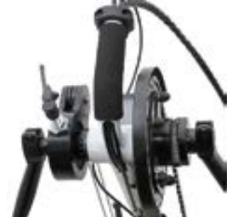
// ATT060051 Rücktrittbremse