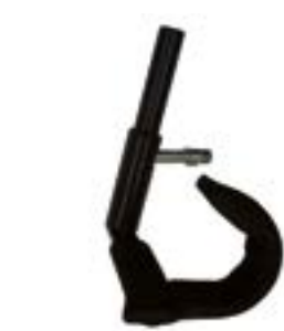
// ATT080028 Tetra Armunterstützung