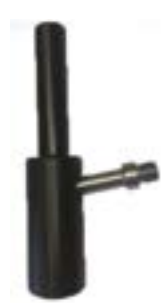
// ATT080023 Griff, vertikal, 10° Winkel, rund, Durchmesser 30 mm