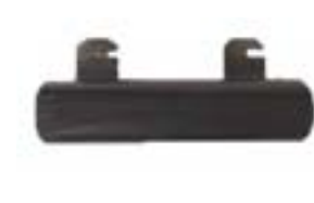
// ATT090084 Zusatzgewicht für verbesserte Traktion, abnehmbar, 5 kg