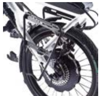
// ATT090082 Taschenhalter