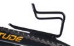
// ATT090081 Flaschenhalter