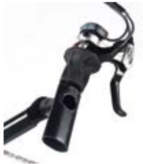
// ATT070042 Drehgriffschalter, 10-fach