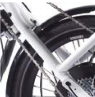
// ATT090095 Schutzblech vorne, verschraubt, schwarz