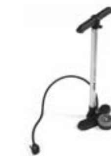
// ATT090024 Standpumpe, Hochdruck (0 - 11 bar)