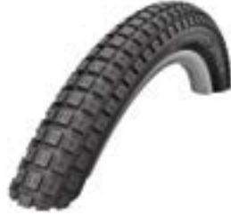
// ATT070110 Grobprofil, Mountainbike