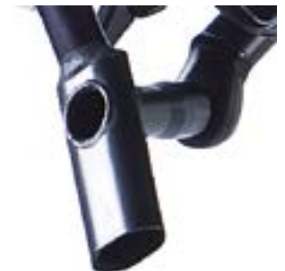
// ATT080025 Griff, vertikal, 25° Winkel, oval, Durchmesser 37 x 21 mm