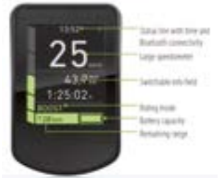
// ATT072102 Farbdisplay „Connect“