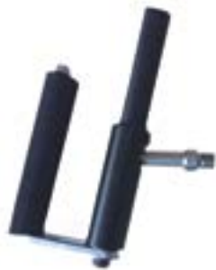
// ATT080027 Tetra Handunterstützung