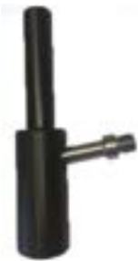
// ATT080023 Griff, vertikal, 10° Winkel, rund, Durchmesser 30 mm