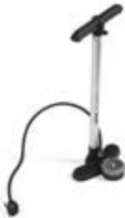
// ATT090024 Standpumpe, Hochdruck (0 - 11 bar)