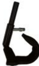
// ATT080028 Tetra Armunterstützung