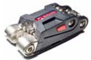
// ATT090041 Multifunktionswerkzeug