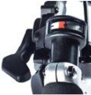
// ATT070045 Daumenschalter