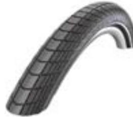
// ATT070111 Luft, Grobprofil, Big Apple (nur Power)