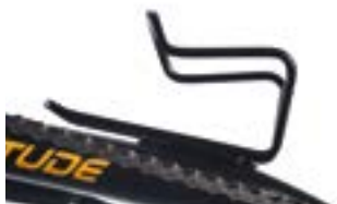
// ATT090081 Flaschenhalter