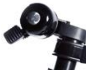
// ATT090085 Klingel